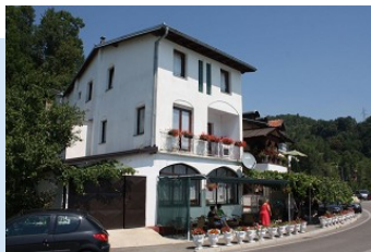
Hotel Veliko Srce